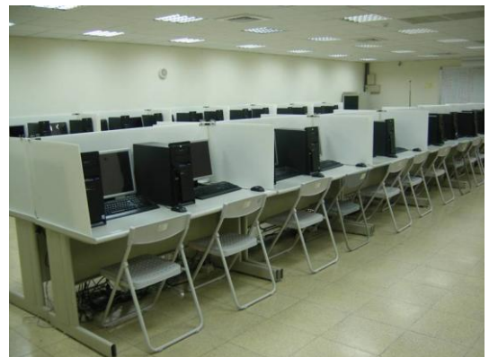
以珍珠板做為隔板之範例