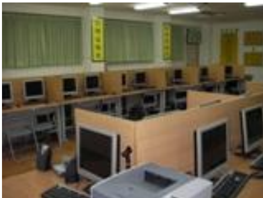
以木板作為隔板之範例